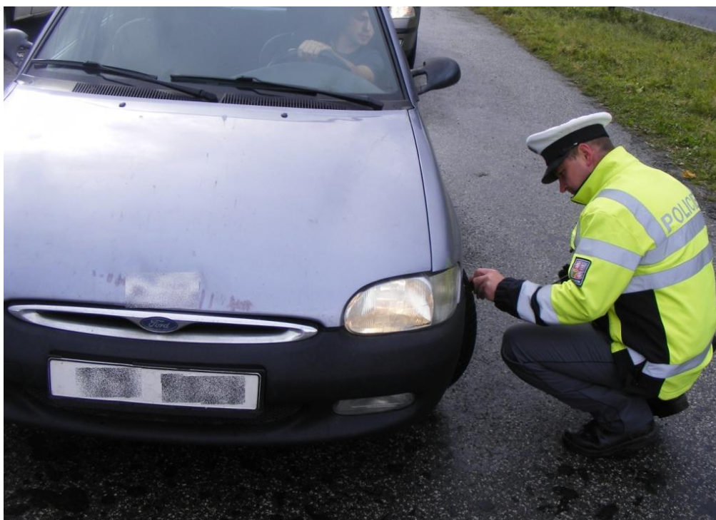
Ilustrační foto PČR

Listopadovou společnou preventivní akci novojičínských a vsetínských policistů hodnotíme kladně. Výsledně jsme byli mile překvapeni. Ačkoli znění zákona dává prostor k různému pochopení, většina řidičů svou bezpečnost nebere na lehkou váhu. Nicméně hned jedna z prvních kontrolovaných řidiček měla pneumatiku absolutně nevhodnou. Beze vzorku s obnaženým kordem. Bylo zarážející, že se jednalo o vozidlo firmy, která prodává autodíly. Tři kontrolovaní řidiči však preventivní kontrolou neprošli. Zjistili jsme u nich, že požili před jízdou alkohol. Akce podobného typu v průběhu měsíce listopadu ještě budeme opakovat, byť v menším měřítku a pouze teritoriálně.