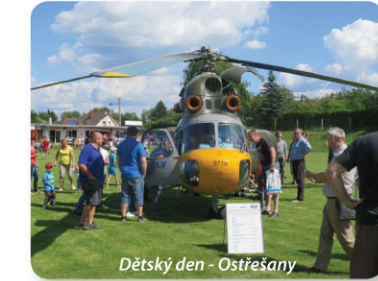
Dětský den - Ostřešany

A co takhle vychutnat si masopustní průvod, kouzelné koncerty v místních kostelích či Hry bez hranic, které mají neopakovatelné venkovské kouzlo. To stojí za