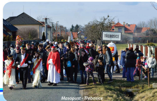
Masopust - Třebosice