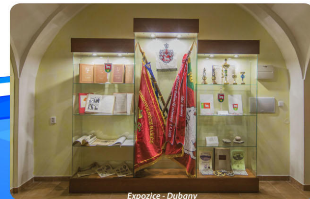
Expozice - Dubany

Obec vešla do dějin archeologie významnými nálezy (bronzový poklad), které byly učiněny v letech 1881 a 1884 na zdejších pozemcích. V roce 1932 byly v prostoru bývalé cihelny nalezeny v hloubce asi 1 metr kostrový hrob s hlíněnou nádobkou a v hloubce 7 metrů dvě stoličky mamuta. Život v obci je však pestrý i v současnosti a každý si najde to své. Je zde např. mateřská školka s kouzelnou zahradou či Univerzita III. věku pro místní seniory. Zázemí obecního domu s podíem vybízí místní spolky ke konání mnoha akcí. Cílem klidné procházky může být i kaplička sv. Marie Karmelitské ve stínu mohutných stromů.