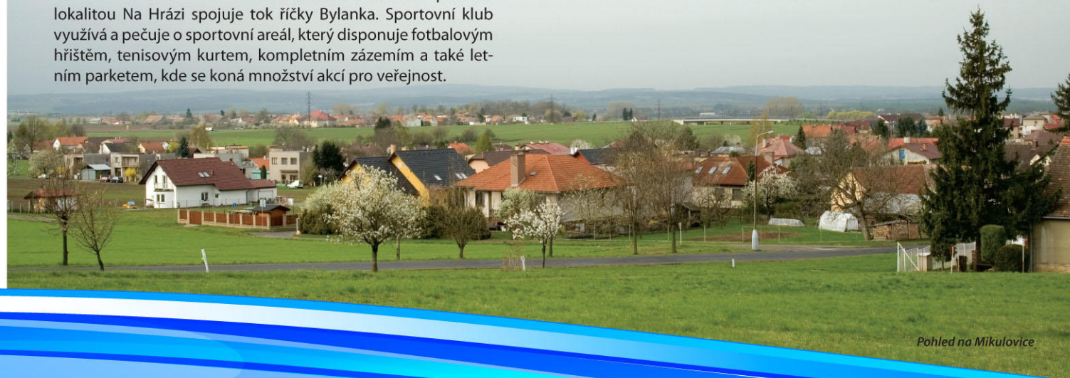
Pohled na Mikulovice

Historická návěs je příjemným centrem obce z části se zachovalou tradiční architekturou. Dřevěná zvonice a socha sv. Jana Nepomuckého tvoří její dominantu. Návěs s přírodní lokalitou Na Hrázi spojuje tok říčky Bylanka. Sportovní klub využívá a pečuje o sportovní areál, který disponuje fotbalovým hřištěm, tenisovým kurtem, kompletním zázemím a také letním parketem, kde se koná množství akcí pro veřejnost.