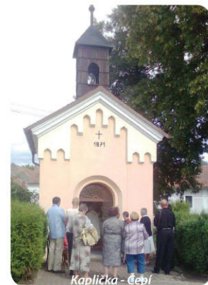
Kaplička - Čepí