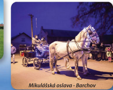
Mikulášská oslava - Barchov