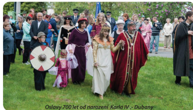
Oslavy 700 let od narození Karla IV. - Dubany