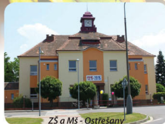
ZŠ a MŠ - Ostřešany

příjemného školského areálu se zahradou, vybaveného sportovního areálu, tak i klidové zóny v podobě přírodních parků. Místní spolek rybářů se kromě výkonu rybářského práva stará i o údržbu soustavy rybníků a jejich okolí. Obyvatelé i návštěvníci mohou využít nákup na místní farmě či přímo v sadech si vybrat lokální jablka, která jsou certifikovaným regionálním produktem.