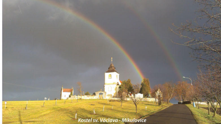
Kostel sv. Václava - Mikulovice

Ostřešany jsou vyhledávanou lokalitou pro bydlení v dosahu měst. Pro své občany vytvářejí jak funkční služby v podobě