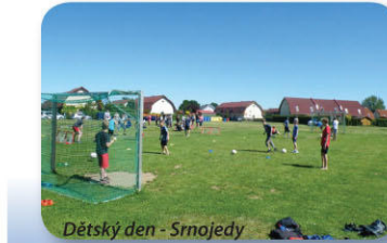
Dětský den - Srnojedy