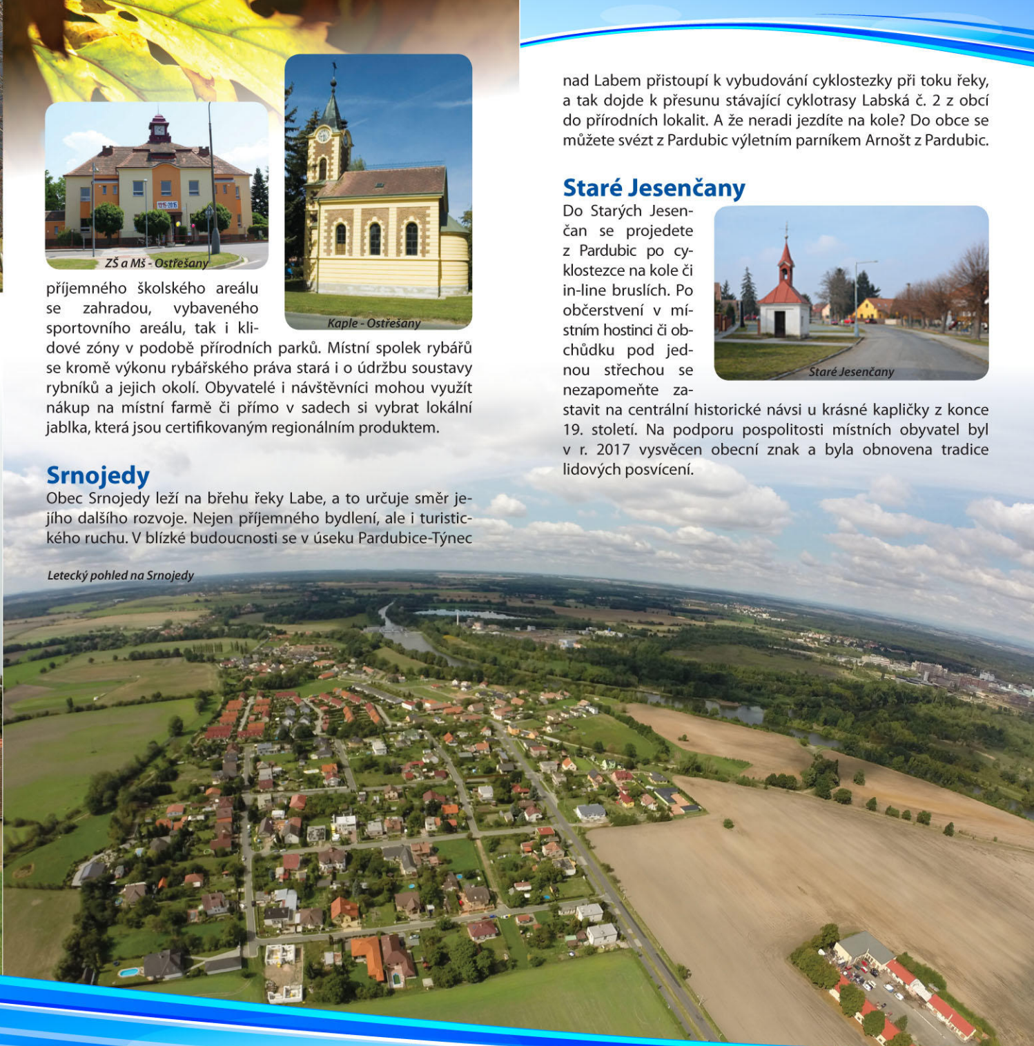
Letecký pohled na Srnojedy

nad Labem přistoupí k vybudování cyklostezky při toku řeky, a tak dojde k přesunu stávající cyklotrasy Labská č. 2 z obce do přírodních lokalit. A že neradi jezdíte na kole? Do obce se můžete svést z Pardubic výletním parníkem Arnošt z Pardubic.