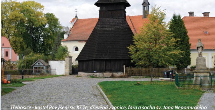
Třebosice - kostel Povýšení sv. Kříže, dřevěná zvonice, fara a socha sv. Jana Nepomuckého