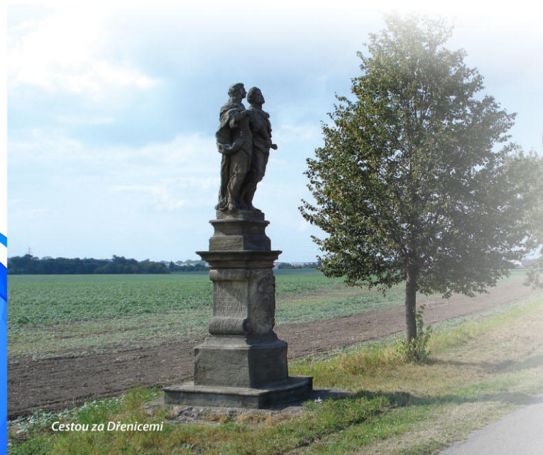
Cestou za Dřenicemi