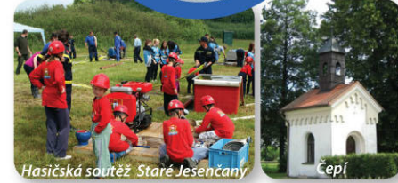
Hasičská soutěž - Staré Jesenčany