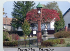
Zvonice - Dřenice

Dubany jsou sice malá obec, ale s bohatým veřejným životem. Spolky pořádají akce pro obyvatele a návštěvníky a nejsou to akce ledajaké. Rybářské závody či plesy jsou zavedené, ale např. takový pěstitelský koš nebo srazy rodáků patří mezi unikátní. Obec je vyhlášena místním zahradnictvím – rodinnou firmou, která částí své lokální produkce podporuje pěstitelskou činnost obyvatel regionu.