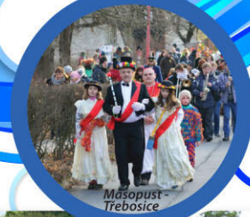
Masopust - Trebovice