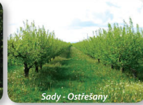
Sady - Ostřešany