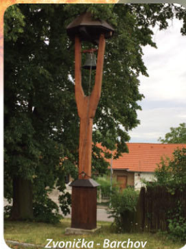
Zvonice - Barchov

Barchov je nejmenší obec s počtem cca 180 obyvatel. Charakter bydlení je převážně přírodní. Pospolitosť obyvatel se odráží při pořádání místních akcí pro děti i dospělé. Můžete si na místní statek dojít pro čerstvé mléko. Projít se upraveným parkem. Posadit se v obecním sadu „Za Humny“, který vysadili v r. 2010 sami obyvatelé. A když půjdete okolo v příhodné době, budete se zde moci občerstvit zdejším pestrým ovocem, které je určeno pro ušlé pocestné.